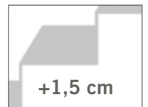
Udvidelse af stigningshøjden