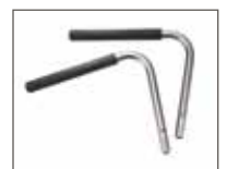
Udvidelse af arm-lænene