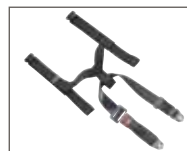
Hoftebælte og sikkerhedsbælte